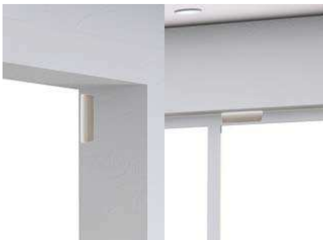
Capteurs TAG© anti-effraction sur portes et fenêtres en liaison radio avec la centrale