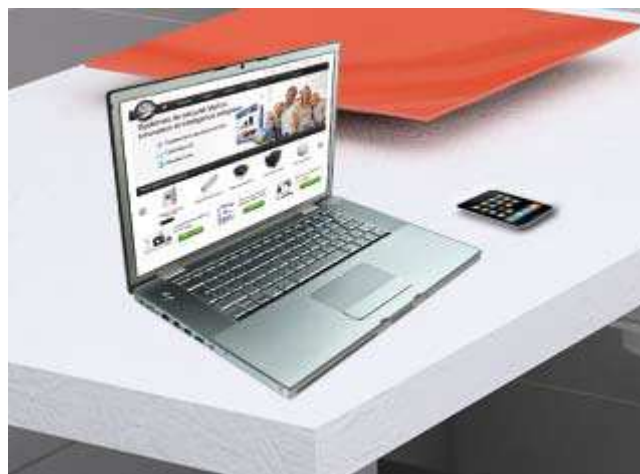
Système pilotable à distance par ordinateur ou mobile