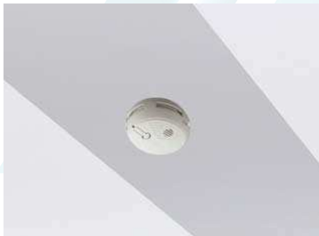
Détecteur de fumée en liaison radio avec la centrale