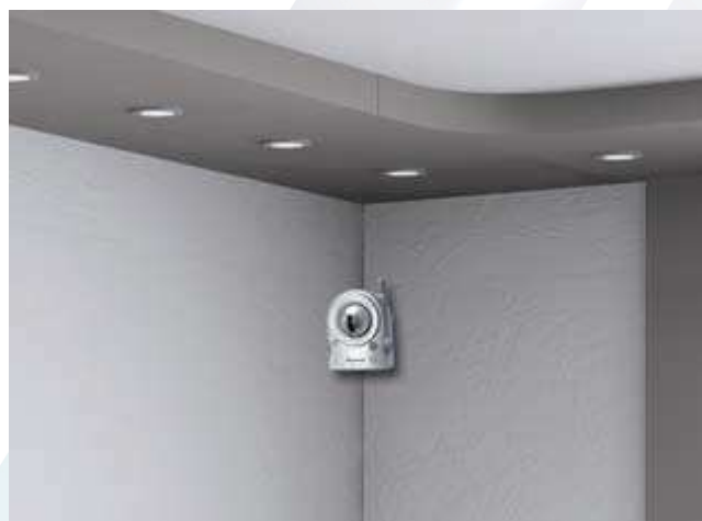
Caméra wifi, détecteur infrarouge intégré, pilotable à distance